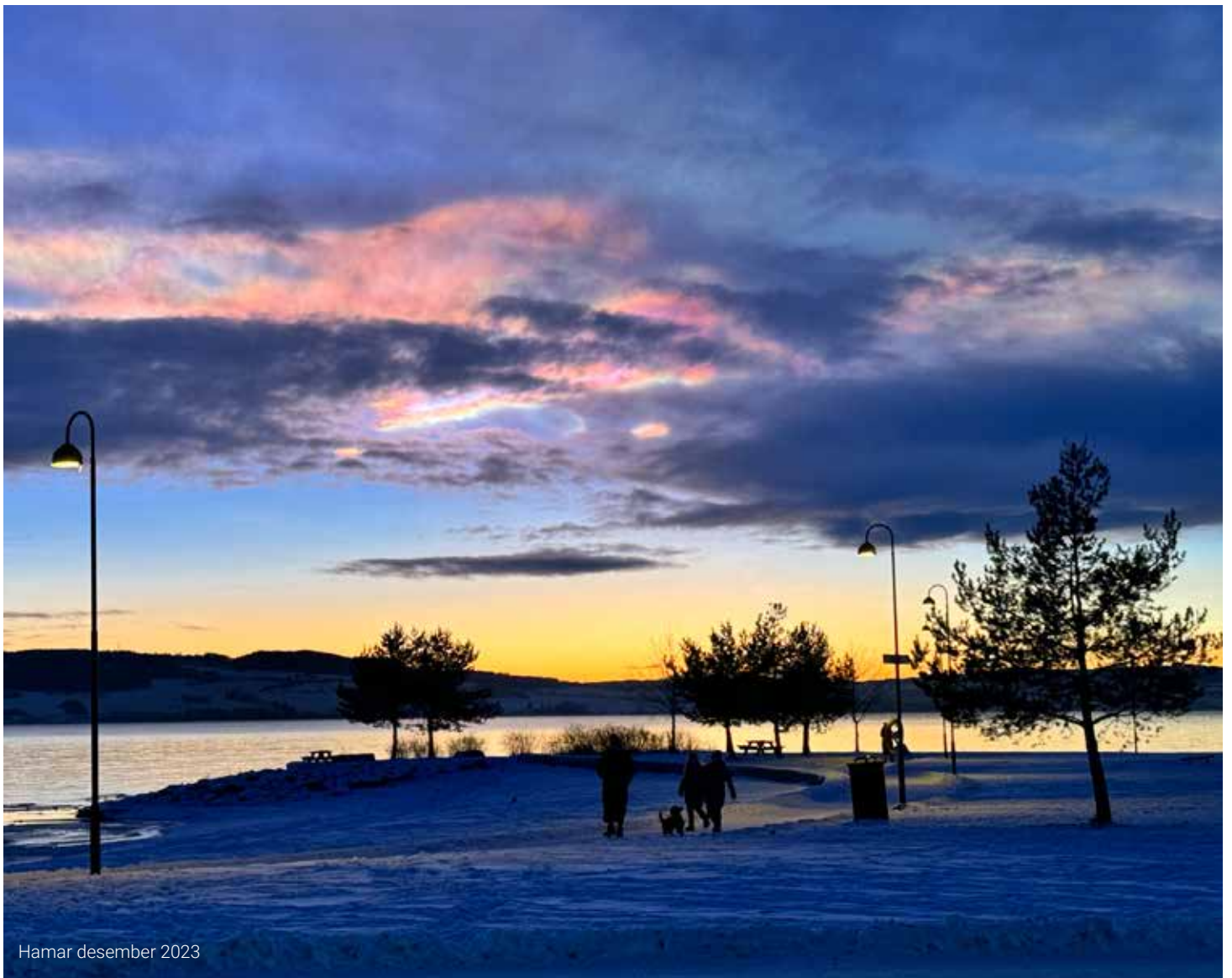
Hamar desember 2023

Nå som det er på tampen av året, gjør jeg meg visse tanker om hvordan året har vært for Norsvin, for avlsavdelingen og de norske avlsbesetningene, spesielt for foredlingsbesetningene. I år har vi feiret 60-årsjubileum for det organiserte avlsarbeidet og etableringen av landsvin foredlingsbesetningene. For en reise det har vært, med betydningsfulle bidrag fra mange dyktige foredlingsbesetninger opp gjennom tiden! 60-årsjubileet preget selvfølgelig en stor del av avlsbesetningsmøtet i år, og vi setter stor pris på at den store oppslutningen. Det er en viktig møteplass for oss alle! Et visst vemod var det også i år, i og med at flere av foredlingsbesetningene gir seg i løpet av 2024 når kravet om SPF innføres. En stor og oppriktig takk til dere alle! Samtidig er det flere nye foredlingsbesetninger som har startet opp og er i ferd med å etablere seg. Det ser ut til at de er godt i gang og vi ønsker lykke til!